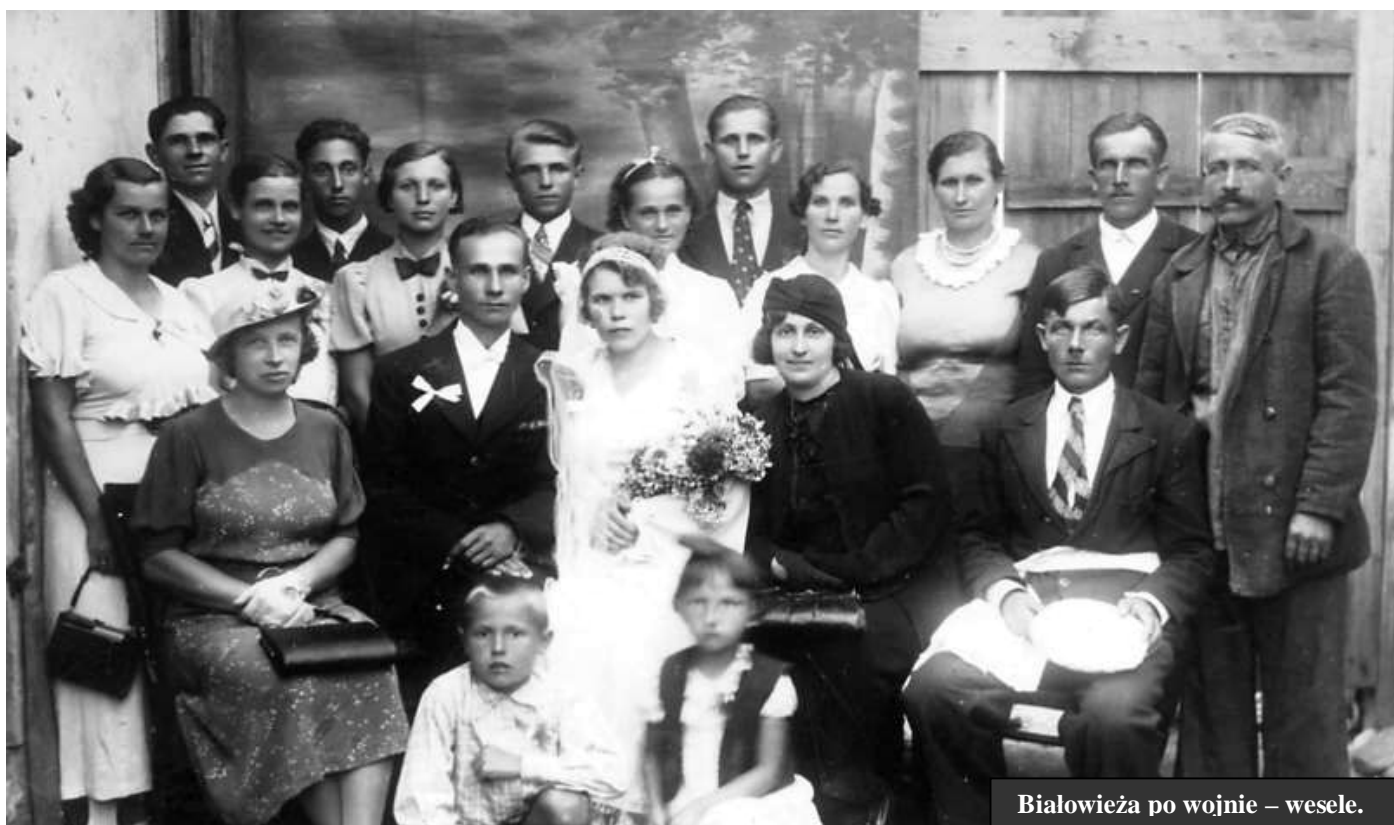
Białowieża po wojnie – wesele.