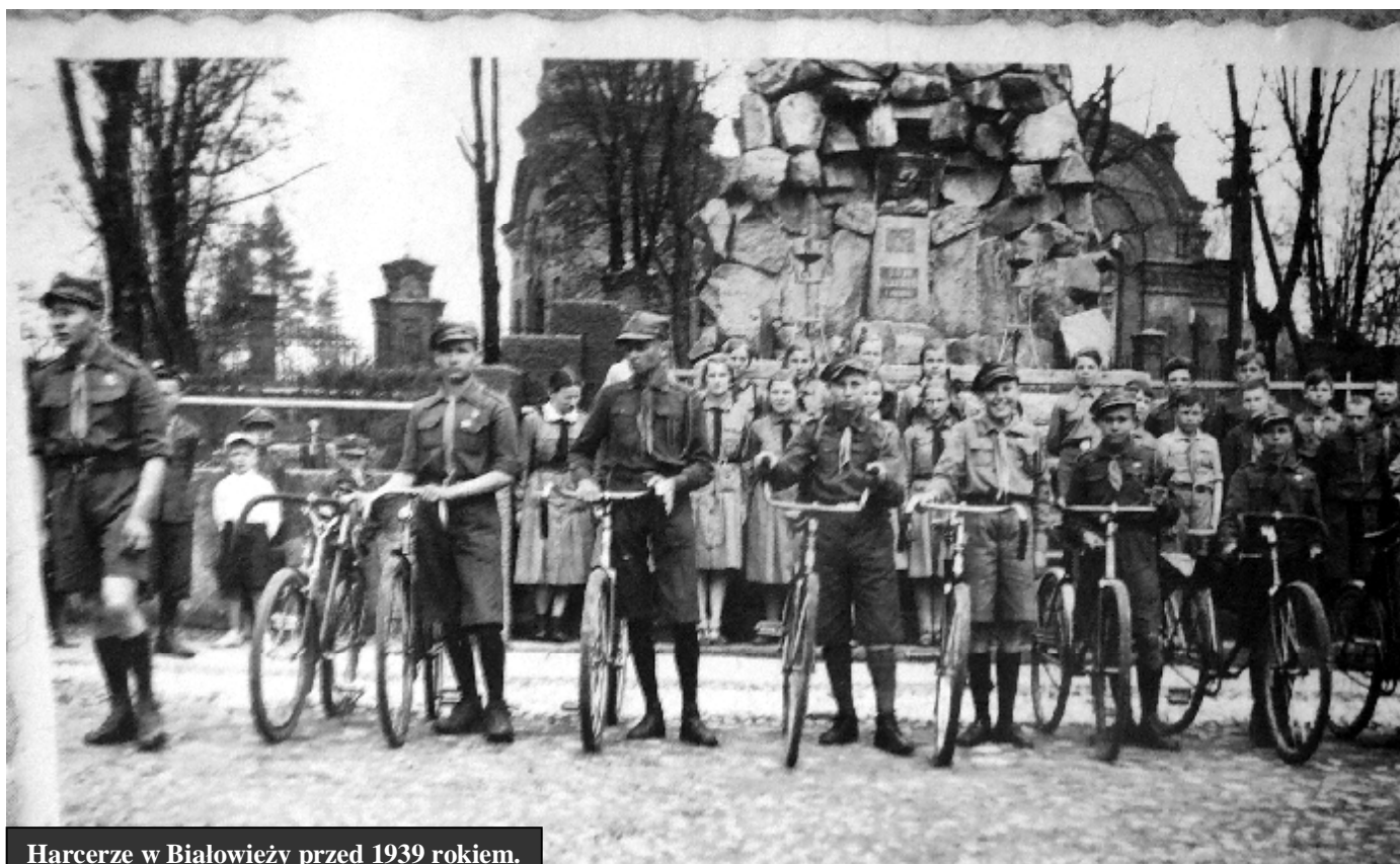
Harcerze w Białowieży przed 1939 rokiem.